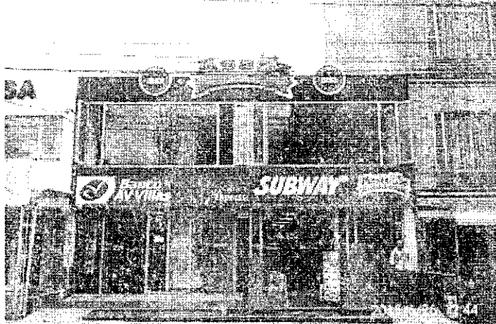
Fotografía No. 1: Establecimiento SUBWAY de YOI SUB S.A.S., ubicado en la AVENIDA CALLE 24 No. 40 – 23.

Registro fotográfico, Visita No. 1 efectuada el día 26/05/2015