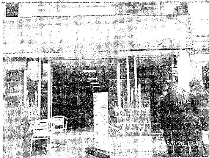
Fotografía No. 2: Establecimiento SUBWAY de YOI SUB S.A.S., ubicado en la AVENIDA CALLE 24 No. 40 – 23.